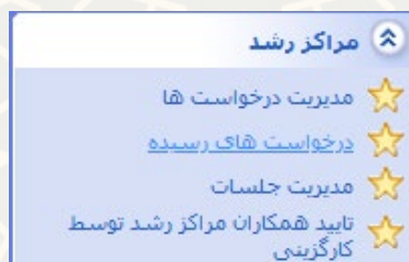
شکل ۱۱-۳: درخواست‌های رسیده در زیرسامانه مراکز رشد سامانه ساعد

مدیر مرکز رشد برای دسترسی به این فرایند الکترونیکی باید در سامانه سدف، از طریق سامانه اطلاعات علمی دانشگاه (ساعد)، به منوی مراکز رشد رفته و گزینه درخواست‌های رسیده را انتخاب نماید (شکل ۱۱-۳). در این حالت فهرست درخواست‌های رسیده پذیرش از مراکز رشد نمایش داده می‌شود (شکل ۱۲-۳).