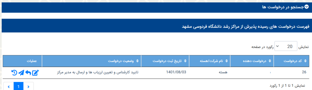
شکل ۱۲-۳: فهرست درخواست‌های رسیده در صفحه مدیر مرکز

مدیر در این بخش به بررسی کاربرگ پذیرش، مستندات و ارزیاب‌های تعیین شده می‌پردازد (شکل ۱۳-۳).