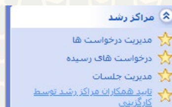
شکل ۲۳-۳: تایید همکاران مراکز رشد توسط کارگزینی در زیرسامانه مراکز رشد سامانه ساعد

پس از این که درخواست به وضعیت تایید نهایی رسید. لیست همکاران طرح جهت ثبت در سیستم کارگزینی به کارشناس کارگزینی ارسال می‌گردد. برای دسترسی به این فرایند الکترونیکی باید در سامانه سدف، از طریق سامانه اطلاعات علمی دانشگاه (ساعد)، به منوی مراکز رشد رفته و گزینه تایید همکاران مراکز رشد توسط کارگزینی را انتخاب نمایید (شکل ۲۳-۳).