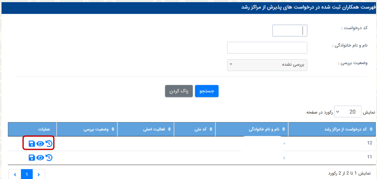
شکل ۲۴-۳: لیست همکاران مرکز