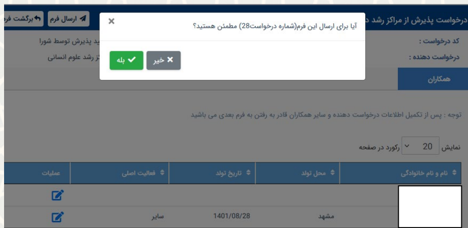
شکل ۲۰-۳: ابراز اطمینان از تایید درخواست