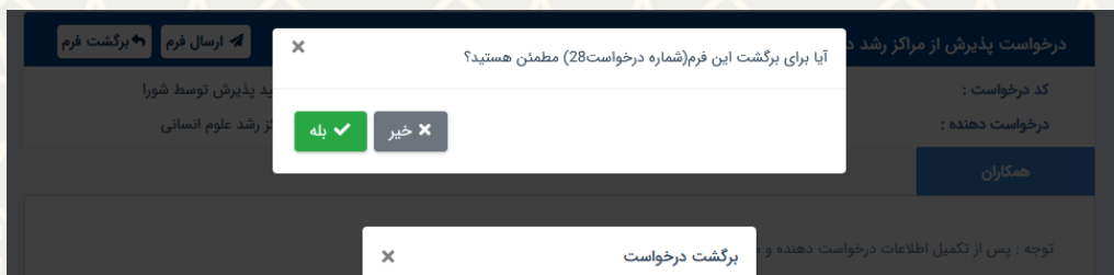
شکل ۲۲-۳: ابراز اطمینان از عدم تایید درخواست