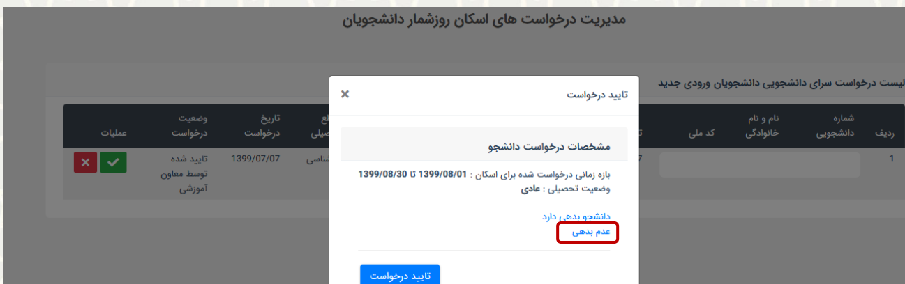
شکل ۱۱-۳: تایید درخواست خوابگاه توسط کارشناس اداره رفاه