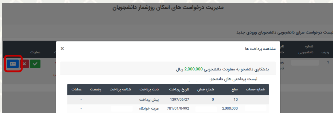
شکل ۱۰-۳: مشاهده جزییات پرداخت بدهی دانشجو

چنانچه دانشجو بدهی نداشته باشد، گزینه عدم بدهی و سپس گزینه «تایید درخواست» انتخاب می‌شود (شکل