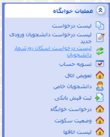
شکل ۸-۳: لیست درخواست اسکان روز شمار دانشجویان در منوی امکان عملیات خوابگاه سامانه معاونت دانشجویی سدف

در صفحه انتخاب شده، کارشناس اداره رفاه لیست درخواست‌های دانشجویان را مشاهده می‌نماید. جهت تایید درخواست گزینه و جهت عدم تایید می‌تواند گزینه را کلیک نماید. در صورت کلیک بر روی ، صفحه تایید درخواست باز می‌گردد. در این صفحه وضعیت بدهی دانشجو در دو حالت «بدهی دارد» و «عدم بدهی» قابل انتخاب است. چنانچه دانشجو بدهی داشته باشد، باید مبلغ و محل بدهی مشخص شود. محل بدهی، «بدهی به دانشگاه» یا «بدهی به صندوق رفاه» است. سپس گزینه «ثبت بدهی» را کلیک می‌نماید (شکل ۹-۳).