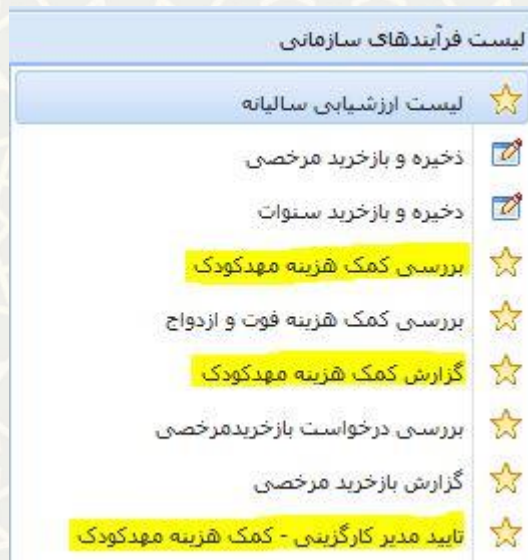
شکل ۳-۱: منوی لیست فرآیندهای سازمانی در سامانه کارگزینی سامانه سدف

طبق قانون کلیه کارکنان خانم دارای فرزند تا ۳ سال، می‌توانند از کمک هزینه مهدکودک بهره‌مند شوند. در فرایند طراحی‌شده کنونی، پس از ثبت حکم بازگشت به کار بعد از اتمام مرخصی دوره زایمان، سامانه به صورت خودکار درخواست کمک هزینه مهدکودک را برای بررسی و تایید ثبت می‌کند. همچنین در ابتدای هر سال برای واجدان شرایط که فرزندی کمتر از ۳ سال داشته باشند (تا پایان همان سال (به شرط عدم تحقق ۳ سالگی فرزند) یا پایان ۳ سالگی)، درخواست پرداخت کمک هزینه مهدکودک ثبت می‌شود. درخواست‌های ثبت‌شده باید توسط کارشناس مدیریت اداری و رفاهی بررسی و تایید شود. به این منظور در سامانه سدف و سامانه کارگزینی، منوی لیست فرآیندهای سازمانی و گزینه بررسی کمک هزینه مهدکودک (شکل ۳-۱) را انتخاب کنید، صفحه لیست کمک هزینه مهدکودک نمایش داده می‌شود (شکل ۳-۲).