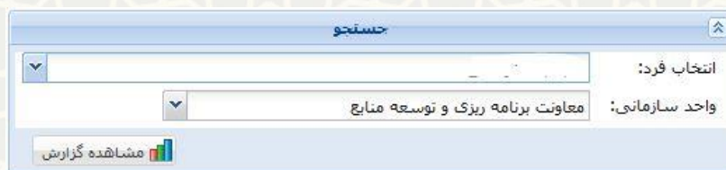
شکل ۶-۳: صفحه گزارش کمک هزینه مهدکودک

مشاهده کمک هزینه‌های ثبت‌شده از طریق سامانه کارگزینی، منوی لیست فرآیندهای سازمانی (شکل ۱-۳) و گزینه گزارش کمک هزینه مهدکودک امکان‌پذیر است (شکل ۶-۳).