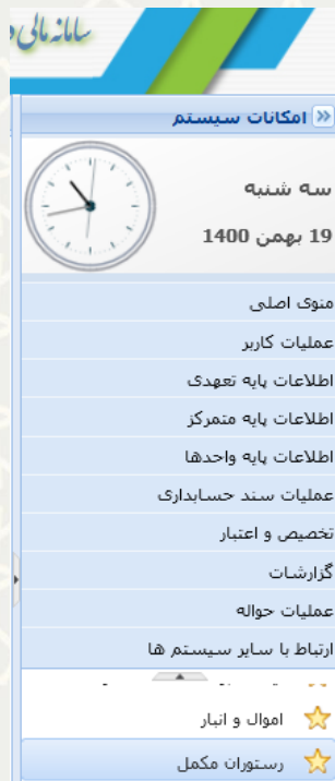
شکل ۳-۱۳: گزینه رستوران مکمل، منوی ارتباط با سایر سیستم ها در سامانه مالی دانشگاه فردوسی مشهد

کارشناس مالی لیست صورت وضعیت‌های تایید شده را مشاهده می‌نماید و امکان صدور سند را دارد (شکل ۳-۱۴). به منظور صدور سند، ابتدا ردیف مورد نظر را انتخاب نمایید، سپس گزینه دریافت سند را کلیک نمایید. توجه: ردیفی که هنوز سندی صادر نشده باشد، شناسه سند آن صفر است و به محض دریافت سند، شماره سند پر می‌شود.