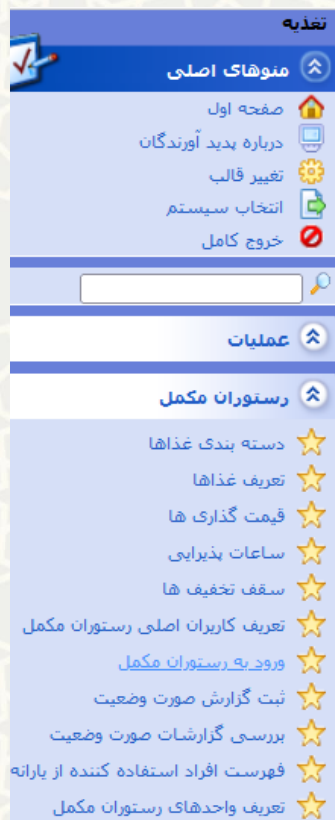
شکل ۳-۱ : ورود به رستوران مکمل ، منوی رستوران مکمل در سامانه تغذیه

در فرآیند ورود به رستوران مکمل، صفحه ورود به رستوران مکمل در اختیار کارشناس حوزه قرار می‌گیرد. برای این منظور از سامانه تغذیه، منوی مدیریت رستوران مکمل، گزینه ورود به رستوران مکمل انتخاب گردد (شکل ۳-۳). صفحه ورود به رستوران مکمل نمایش داده می‌شود (شکل ۳-۴).