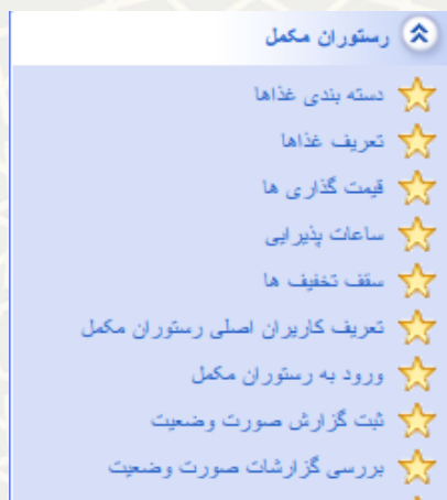
شکل ۳-۱۱: بررسی گزارش صورت وضعیت، منوی رستوران مکمل در سامانه تغذیه

امکان بررسی صورت وضعیت برای کارشناس فراهم گشته است. برای این منظور از سامانه تغذیه، منوی مدیریت رستوران مکمل، گزینه بررسی گزارش صورت وضعیت انتخاب گردد (شکل ۳-۱۱).