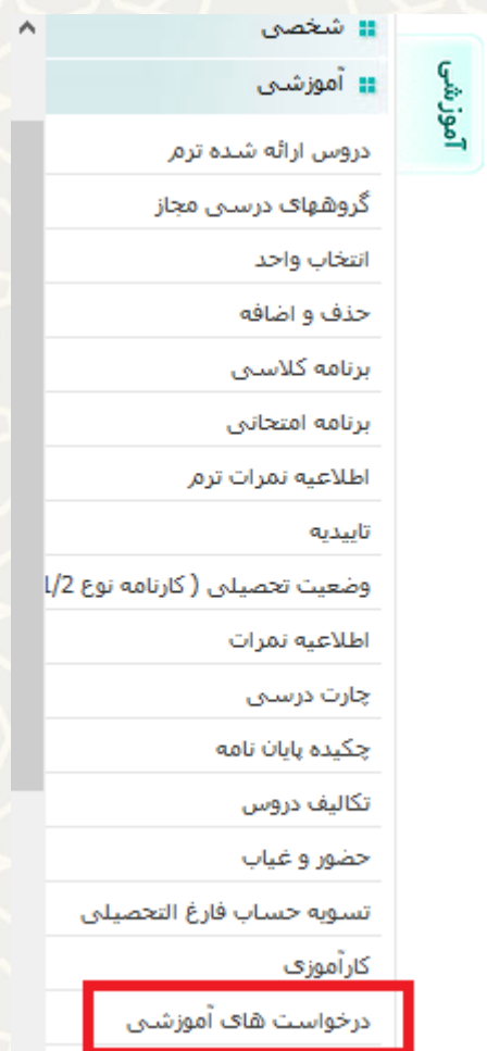
شکل ۳-۱: منو آموزشی / زیرمنو درخواست‌های آموزشی

دانشجو برای ثبت درخواست لازم است از لبه آموزشی در پرتال پویا، زیرمنوی درخواست‌های آموزشی (شکل ۳-۱)، صفحه فهرست درخواست‌های آموزشی (شکل ۳-۲) را باز کنید.