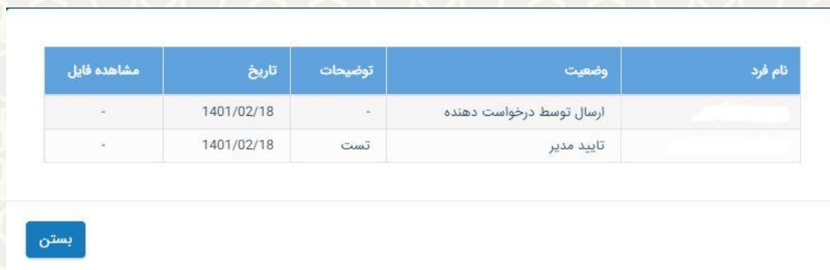
شکل ۳-۵: صفحه تاریخچه درخواست