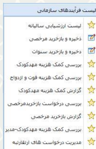
شکل ۳-۱: لیست فرآیندهای سازمانی / مدیریت درخواست‌های ارتقا رتبه

برای بررسی درخواست‌های ارسال شده، از سیستم کارگزینی، منو لیست فرآیندهای سازمانی، زیر منو مدیریت درخواست‌های ارتقا رتبه (شکل ۳-۱)، صفحه لیست درخواست‌های ارتقا رتبه را باز کنید (شکل ۳-۲).