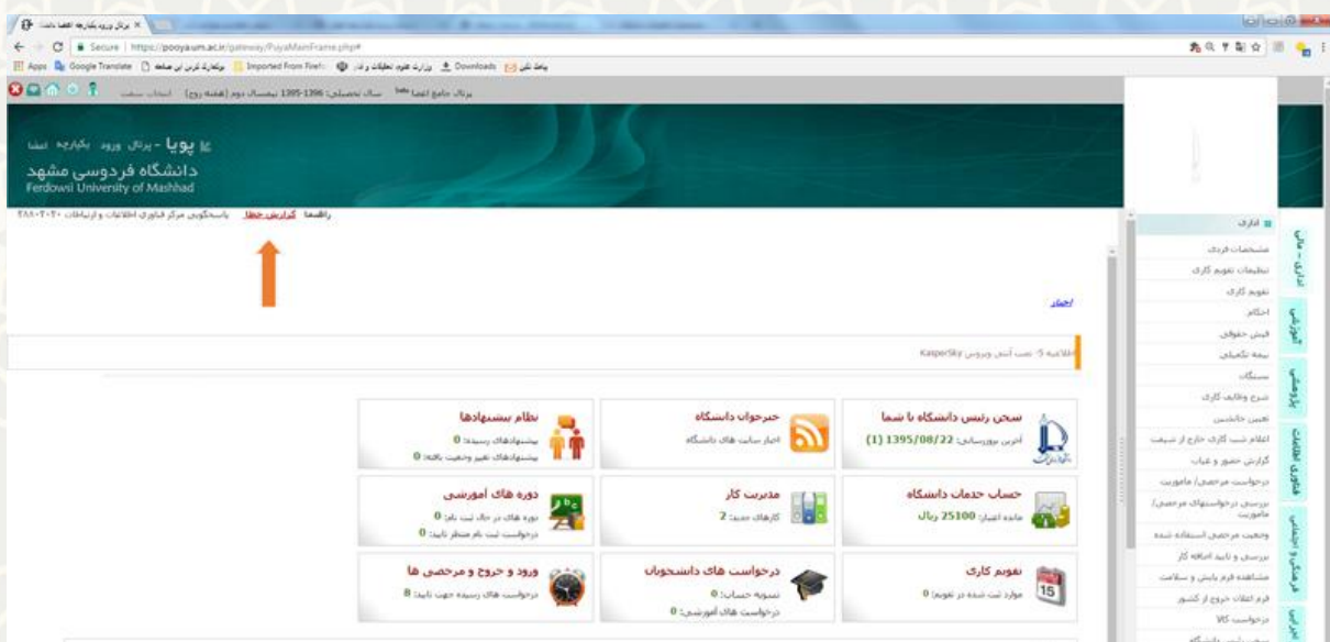
تصویر ۱: پیوند گزارش خطا در پورتال پویا

البته کاربران محترم توجه داشته باشند که برای گزارش مشکلات شبکه و اینترنت، علاوه بر تشریح مشکل، لازم است اطلاعات تکمیلی شامل شماره دانشجویی یا نام کاربری، مکان دقیق مشاهده مشکل (مثلاً مشخصات مکان، شماره اتاق، نام خوابگاه و...) و زمان آن را حتماً ذکر نمایند.