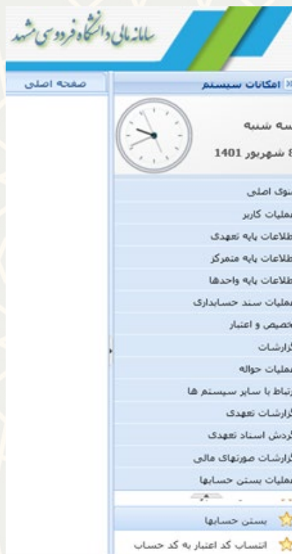
شکل ۳-۴: بستن حسابها در سامانه مالی

کارشناس مالی، برای دسترسی به این فرایند باید در سامانه سدف، از طریق سامانه مالی، به منوی عملیات بستن حسابها برود و گزینه بستن حسابها را انتخاب نماید (شکل ۳-۴).