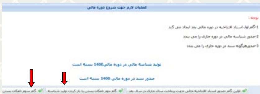
شکل ۳-۳: عملیات لازم جهت شروع دوره مالی - امکان بستن یا باز کردن تولید شناسه و امکان و بستن یا باز کردن دوره