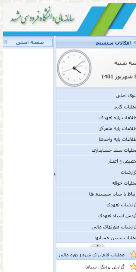
شکل ۱-۳: عملیات لازم برای شروع دوره مالی

کارشناس مالی، برای دسترسی به این فرایند باید در سامانه سدف، از طریق سامانه مالی، به منوی عملیات بستن حساب‌ها رفته و گزینه عملیات لازم برای شروع دوره مالی را انتخاب نماید (شکل ۱-۳).