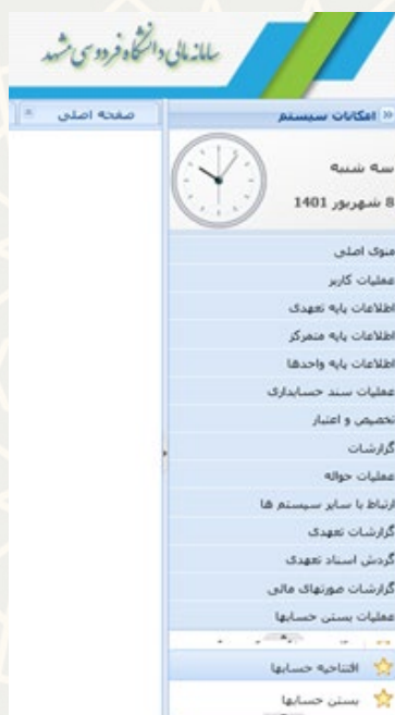
شکل ۷-۳: افتتاحیه حسابها در سامانه مالی

پس از صدور اختتامیه واحدها، امور مالی سازمان مرکزی می‌تواند برای دوره مالی جدید، صدور سند افتتاحیه انجام