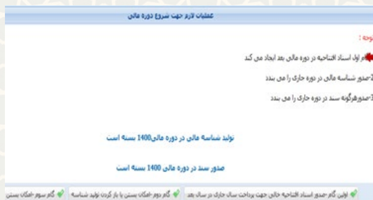
شکل ۲-۳: عملیات لازم جهت شروع دوره مالی - صدور اسناد افتتاحیه خالی جهت پرداخت سال جاری در سال بعد

توجه: این عمل باید در تاریخ ۲۸ اسفند سال جاری انجام شود.