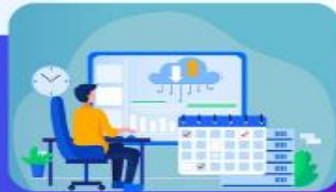
معاونت برنامه ریزی و توسعه منابع