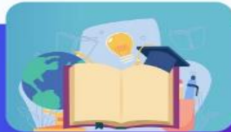
معاونت فرهنگی، اجتماعی و دانشجویی