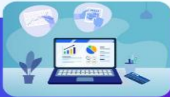
معاونت اداری و مالی