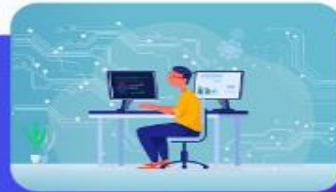
معاونت پژوهش و فناوری