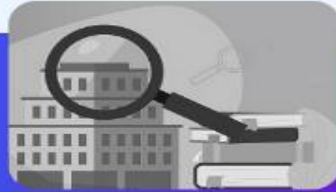
دانشگاه در یک نگاه

صفحه گزارشات عمومی به همراه ایجاد داشبورد اطلاعاتی برای مدیران ارشد