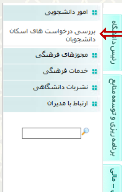
شکل ۱۸-۳: بررسی درخواست اسکان دانشجویان در منوی امور دانشجویی لبه آموزشی پورتال پویا

در صفحه انتخاب شده، برای تایید درخواست باید گزینه و برای عدم تایید، گزینه را کلیک نمایید (شکل