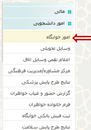
شکل ۱-۳: فرایند الکترونیکی امور خوابگاه در منوی امور دانشجویی لبه آموزشی پورتال پویا

مقتضای خوابگاه برای ارسال درخواست می‌تواند در پورتال پویا از طریق لبه آموزشی و منوی امور دانشجویی، گزینه امور خوابگاه را انتخاب نماید (شکل ۱-۳).