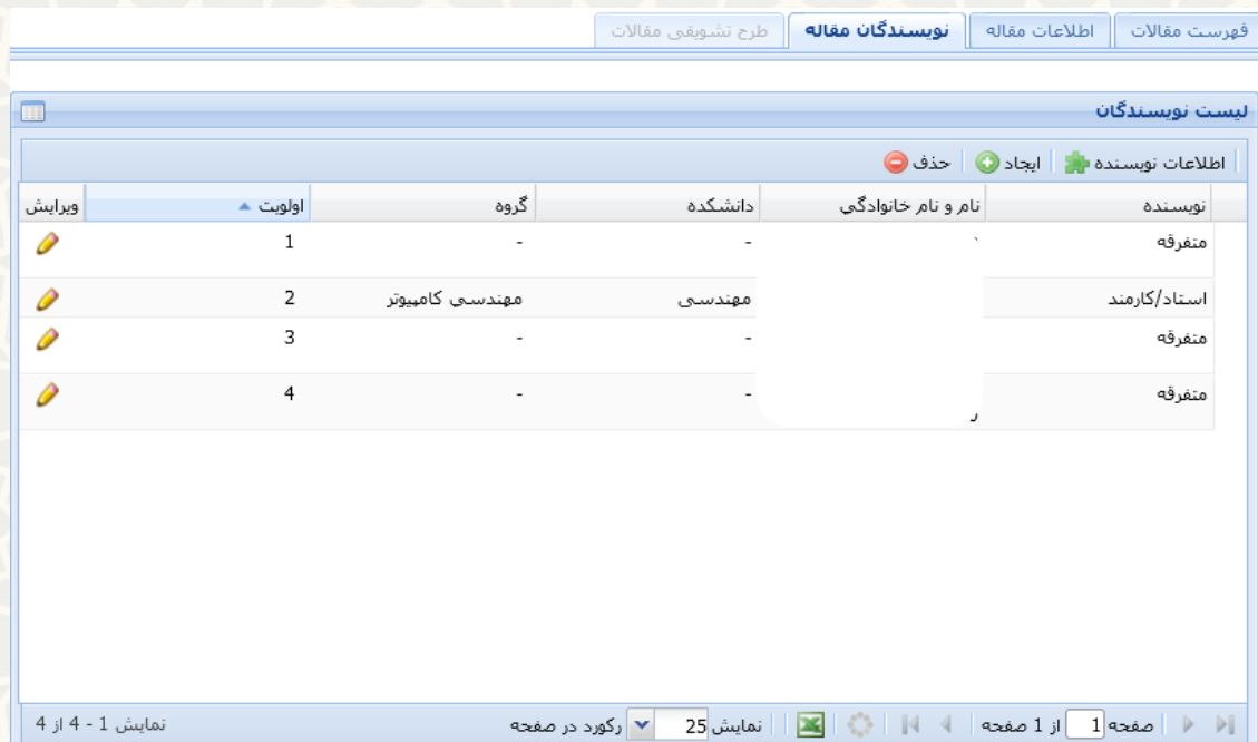
شکل ۳-۶: نویسندگان مقاله

به منظور ثبت نویسندگان مقاله، ابتدا مقاله مورد نظر را انتخاب نمایید و سپس گزینه اطلاعات مقاله را کلیک نمایید. سپس به برگه «نویسندگان مقاله» بروید (شکل ۳-۶).