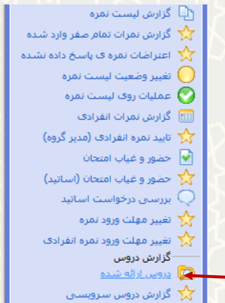
شکل ۳-۱: دروس ارائه شده در زیرسامانه عملیات درس سامانه امور آموزشی دانشجویان در دانشکده‌ها

برای دسترسی به این امکان، باید در سامانه سدف از طریق سامانه امور آموزشی دانشجویان در دانشکده‌ها به زیرسامانه عملیات درس بروید و گزینه دروس ارائه شده را انتخاب نمایید (شکل ۳-۱).