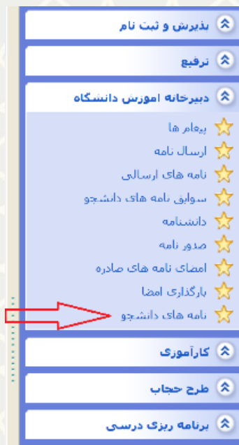
شکل ۳-۱۴: نامه های دانشجو

امکان دریافت فایل pdf برای نامه‌های امضا شده وجود دارد. همچنین نامه‌های صادره ای که هنوز امضا نشده‌اند قابل ویرایش می‌باشند (شکل ۳-۱۵).