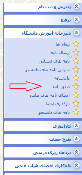
شکل ۱-۳: صدور نامه

برای دسترسی به این زیرسامانه باید در سامانه سدف، از طریق زیر سامانه امور آموزشی دانشجویان در دانشکده‌ها ، به منوی دبیرخانه آموزش دانشگاه بروید و گزینه صدور نامه را انتخاب نمایید (شکل ۱-۳).