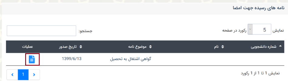
شکل ۳-۹: نامه های رسیده جهت امضا