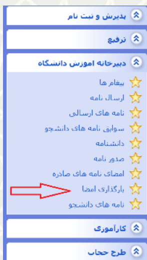
شکل ۳-۱۲: بارگذاری امضا

تصویر امضا باید شفاف و با فرمت jpeg ذخیره و در سامانه بارگذاری شود(شکل ۳-۱۳).