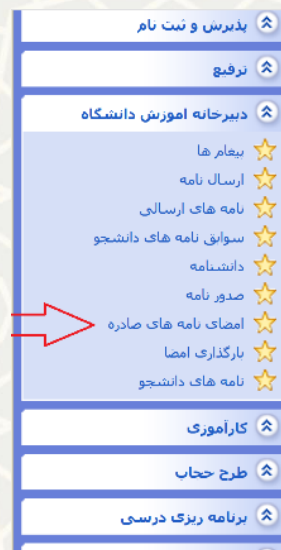
شکل ۳-۸: امضای نامه های صادره

فرد امضاکننده نامه می‌تواند با مراجعه به لینک امضای نامه‌های صادره در سامانه امور آموزشی دانشجویان در دانشکده‌ها، لیست نامه‌های آماده امضا را مشاهده نماید (شکل ۳-۹). و سپس با کلیک بر روی آیکن عملیات نامه متن کامل نامه را جهت تایید مشاهده نماید (شکل ۳-۱۰).