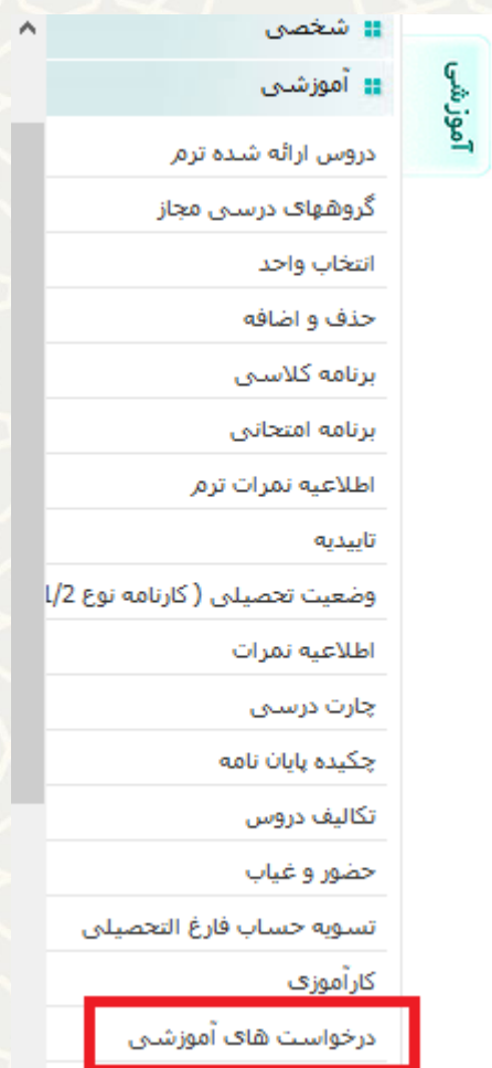
شکل ۳-۱: منو آموزشی / زیرمنو درخواست‌های آموزشی

دانشجو برای ثبت درخواست لازم است از لبه آموزشی در پرتال پویا، زیرمنوی درخواست‌های آموزشی (شکل ۳-۱)، صفحه فهرست درخواست‌های آموزشی (شکل ۳-۲) را باز کنید.